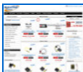
Cables y más http://www.movitelonline.com