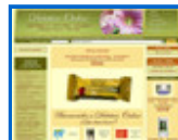
Dietética natural http://dieteticaprofesional.es/b2c/