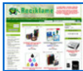
Tienda de consumibles http://reciklame.net/b2c/