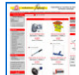
Recambios de aut