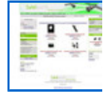
Telefonía y comun http://www.satelman.com