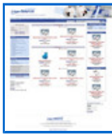
Complementos para alimentación y comercio http://www.lineacomercio.com/b2c/