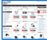
Cables y más http://www.movitelonline.com