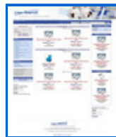
Complementos para alimentación y comercio http://www.lineacomercio.com/b2c/