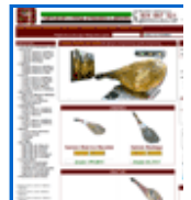
Jamón Ibérico Ext http://ibericoscostaduro.com