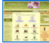
Dietética natural http://dieteticaonline.es/b2c/