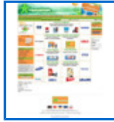
Cartuchos de tinta http://www.tintastar.es/b2c/