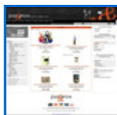
Gourmet y regalos http://www.panandpress.com/b2c/