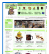
Tienda de cam http://camiset.com