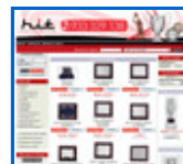
Medallas y Trofeos