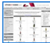
Tienda de vinos y licores http://www.vinosencasa.com