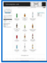
Bebidas premium http://www.boissonprime.com